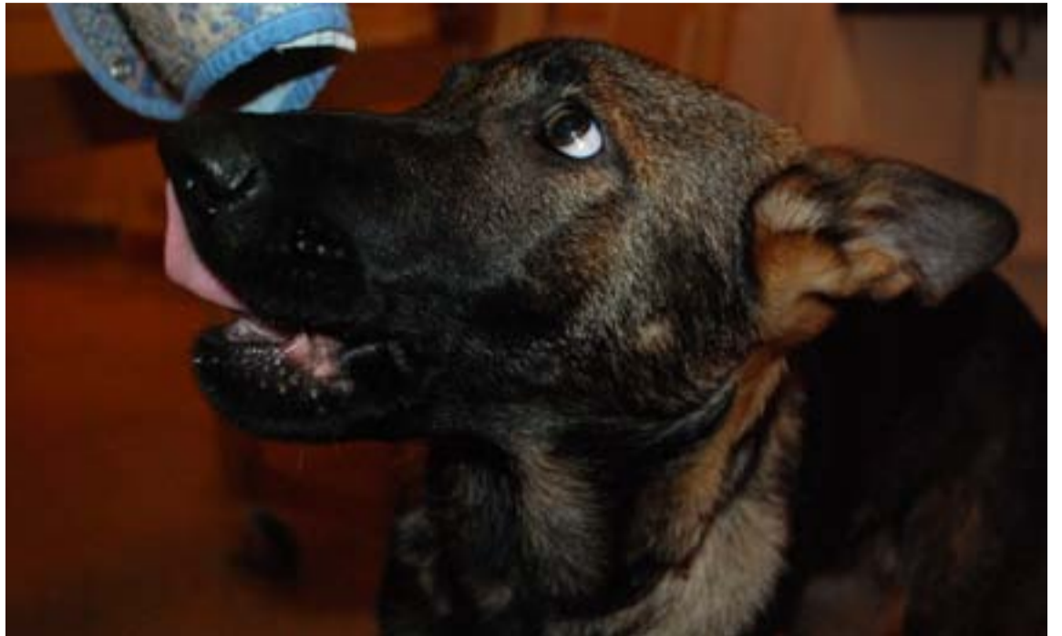
Ullis, som nästa år ska utbildas till vårdhund, slickar sig kring munnen efter att ha undersökt en haklapp som hänger i köket på Björkbackens äldrecentrum.