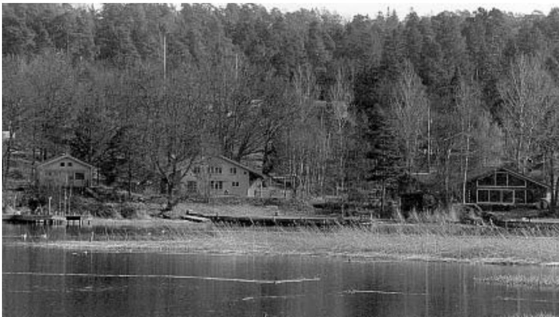
Strandnära bebyggelse på Östra Tyresö.

Men trots att man enligt socialdemokraterna hade otroligt bråttom från den borgerliga majoriteten att fastställa översiktsplanen så har själva genom-