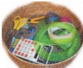
Studiehjälpmedel i alla dess former.