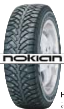
Hakkapeliitta 4 - tyst, bekvämt och med suveränt grepp.