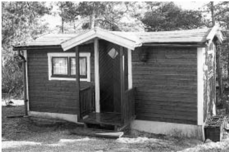
An finns det många små stugor för sommarboende.