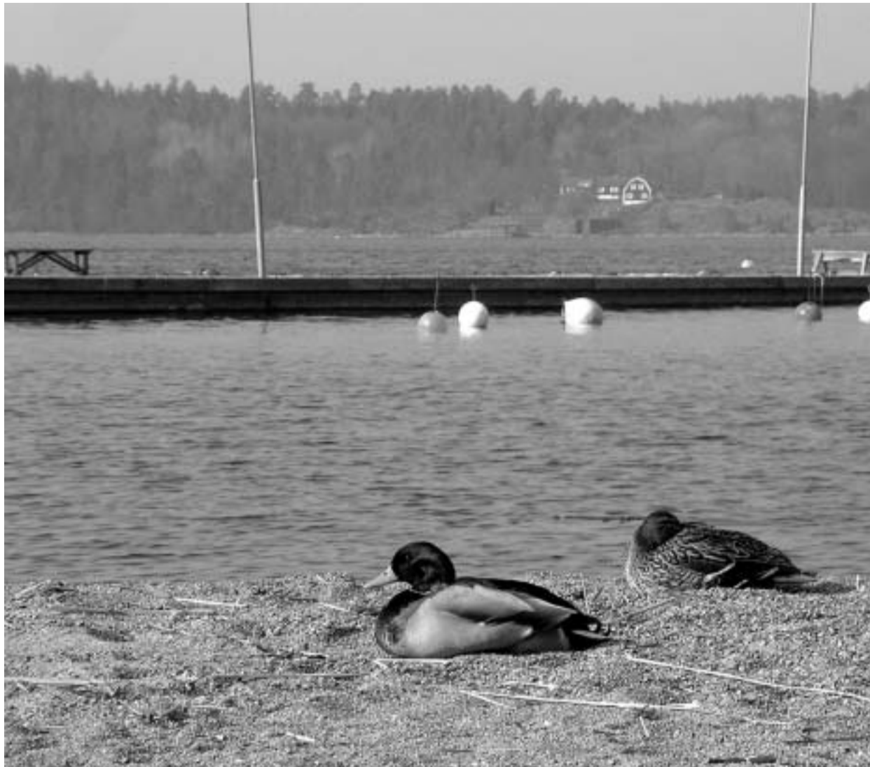
Tyresö är världens finaste plats! Till och med änder gillar våra stränder!

tankar och känslor nedskrivna under extremt kort deadline. En övning i att åstadkomma "något" under tidspress samt formulera sig för en större publik. Ett samarbete som vi hoppas ska ge mersmak både för läsare och elever.