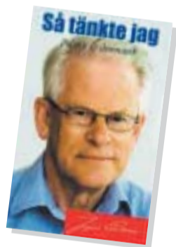
Finns i Tyresö Bokhandel