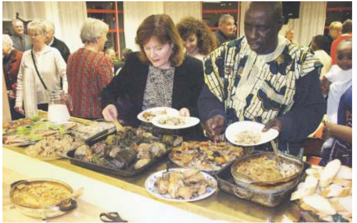
Barn och vuxna lät sig väl smaka av buffén som innehåll såväl orientaliska läckerheter som svensk husmanskost.