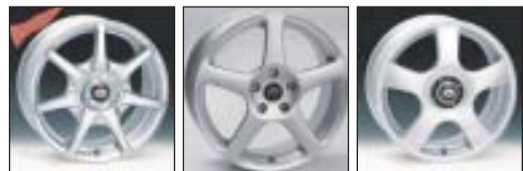
PT Thunder, PT Omega och PT Flash - tre bra vinterfälgar.

Nu har vi både tidsbokning och drive-in vid däckskiften. Välkomna!