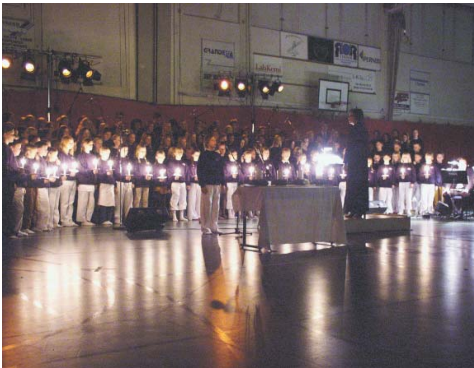
Tyresös musikklasser gav en försmak av julen för en fullsatt Bollmorahallen.