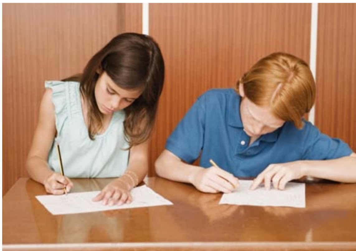
Hur mycket får ett barn kosta? Undervisningskostnaden per barn var 2008 enligt Skolverket 36 300 kronor i Tyresö och 57 700 kronor i Stockholms stad.

Resultaten. 2007 gjorde Tyresö det största tapp i betyg som någon kommun gjort sedan det nuvarande betygssystemet infördes. Efter en kortare uppgång sjunker nu åter resultaten. 2009 klarade 80 procent av eleverna godkänt i alla ämnen. 2010 hade det sjunkit under 75 procent. Därmed placerar sig Tyresö på nedre halvan av landets kommuner. ●